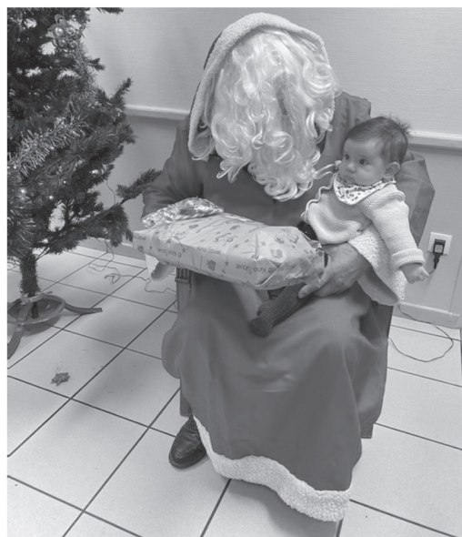
Le père Noël, quand à lui est venu ce qui a ravi les enfants

Le goûter prévu a été annulé suite à un arrêté préfectoral.