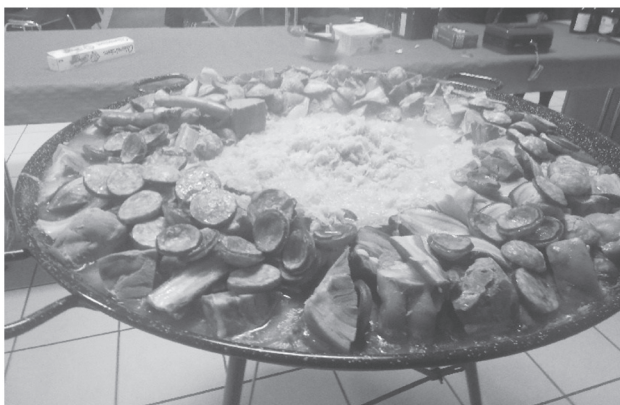
ARBRE DE NOËL DES ENFANTS DE RYES

Le goûter prévu a été annulé suite à un arrêté préfectoral.